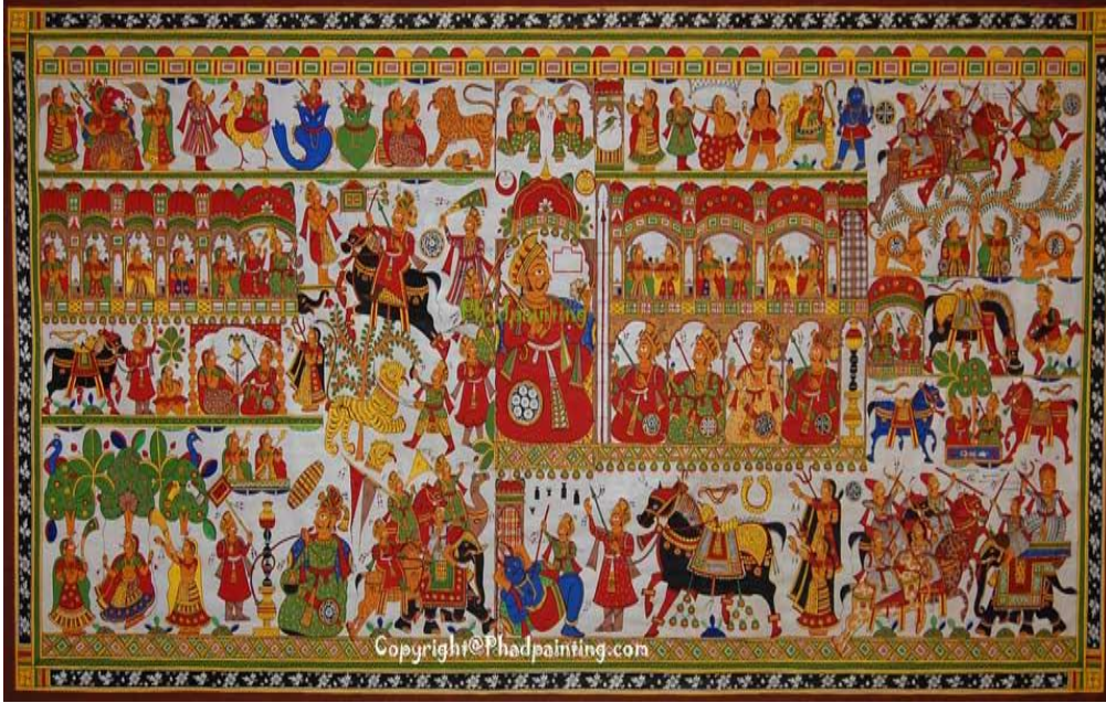
चित्र-1 : पाबूजी की पड